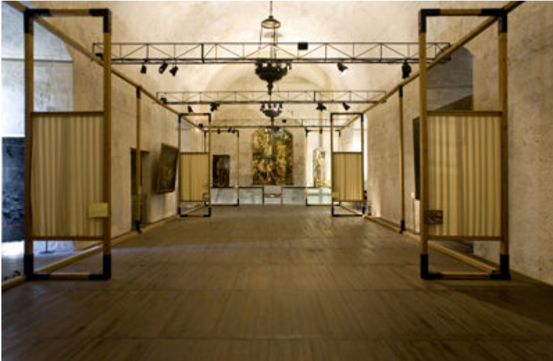
Sala dei Parlamenti