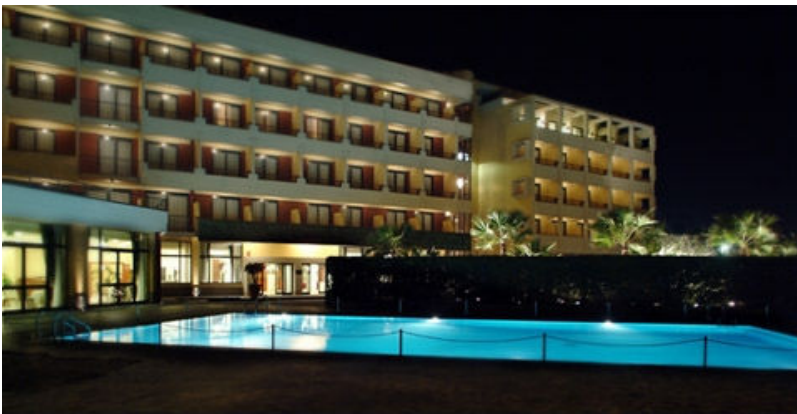
Hotel Nettuno - Catania Aperto tutto l'anno 4 stelle